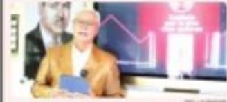
TIJUANA.- Baja California sigue siendo líder en materia de empleo y fomento económico.

TIJUANA.- El gobierno de Baja California, encabezado por Jaime Escobedo Valdez, cuenta con una cuenta de 20 millones de pesos para revitalizar y fortalecer la economía