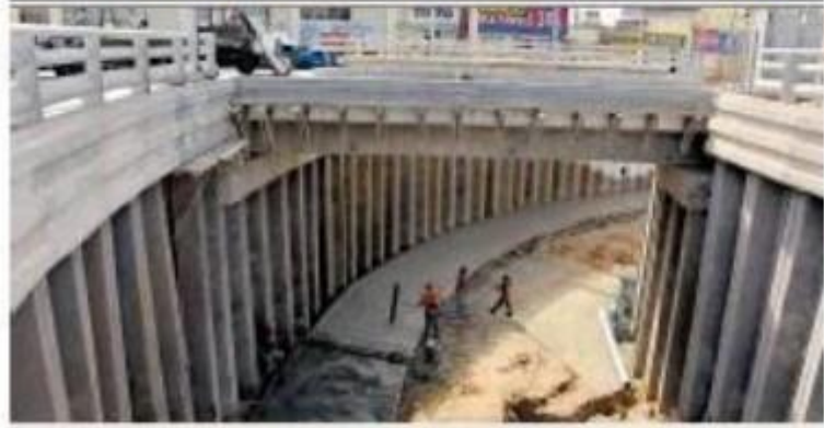
TOMA FORMA EL PASO A DESNIVEL DE LA GARITA VIEJA El puente Aguirre que forma parte del proyecto de rehabilitación de la Garita Vieja y el cual se planea para evitar los embalsamientos de aguas que se forman en la zona de la Garita Vieja y de seguir a Bahuajón.

“Se ha generado un aumento generalizado en la compra de aparatos electrónicos en todo el país, por lo que es necesario realizar campañas de concientización y educación de los consumidores”, dijo.