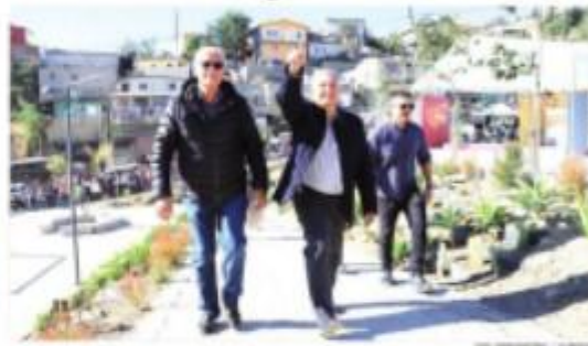
MEXICALI.- Hará gira por Sonora, Baja California Sur y Baja California, e inaugurará en Tijuana un cuartel de Guardia Nacional.

MEXICALI.- El presidente de México, Andrés Manuel López Obrador, anunció en su conferencia matutina desde Palacio Nacional que realizará una gira de trabajo el fin de semana por estados del momento a incluir en su agenda una visita a Tijuana para el sábado 20 de febrero, donde se inaugurará un cuartel de la Guardia Nacional. "Voy el fin de semana a So-